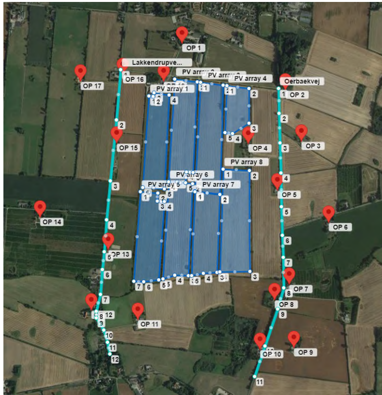
Figur 2 - Solcelleparken tegnet op i Forgesolar, med PV arrays, veje og observationspunkter.

Da området er stort, er beregningen delt op i 8 arealer som beregnes hver for sig og vurderes samlet m.h.t. genskin. Parken er tilnærmelsesvis delt op i et nordligt- og sydligt-felt. Nordlig: PV array 1-4. Sydlig: PV array 5-8.